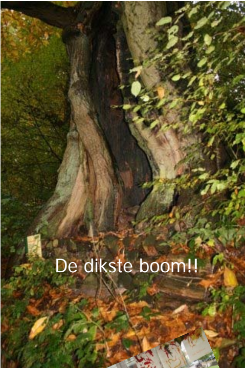
De dikste boom!!